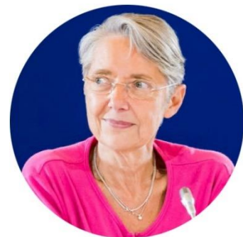
Élisabeth Borne, ministre de la Transition écologique et solidaire

Les perspectives sont vastes, créons les conditions pour qu'elles profitent à tous.